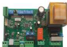
● MOD.MERAK PLUS (EA-00052-00)