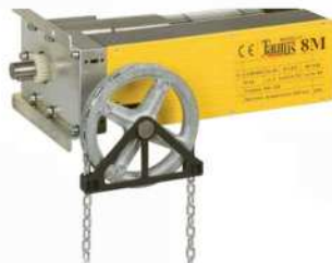
● MOD.SISTEMA MANUAL (EA-00007-00) + (EA-00056-00)