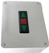
● MOD.MERAK PLUS (EA-00052-00)