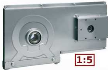
● MOD.MOTOR BRACKET (EA-00061-00)