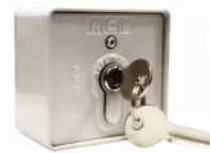
● MOD.CLIC-2PASOS (SA-00104-00)