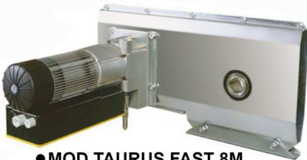
● MOD.TAURUS FAST 8M (EA-00007-00) + (EA-00061-00)