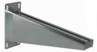
● MOD.SIDE BRACKET (EA-00076-00)